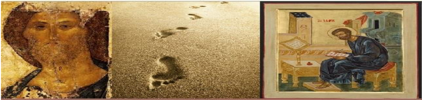
STUDIUL SFINTEI EVANGHELII DUPĂ MARCU

Sf. Marcu nu dă un răspuns complet ci afirmă doar că botezându-se în Iordan, Iisus îi descoperă lui Ioan identitatea lui mesianică.